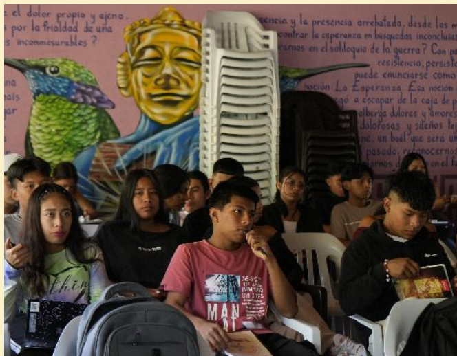
Encuentro de fortalecimiento Comunicación Comunitaria-CRIDEC