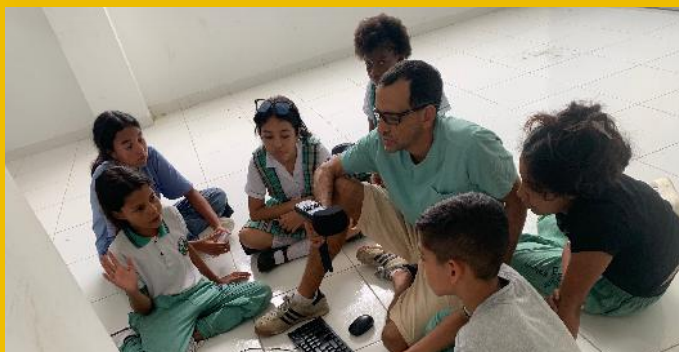
Jóvenes y niños Institución Educativa José Celestino Mutis