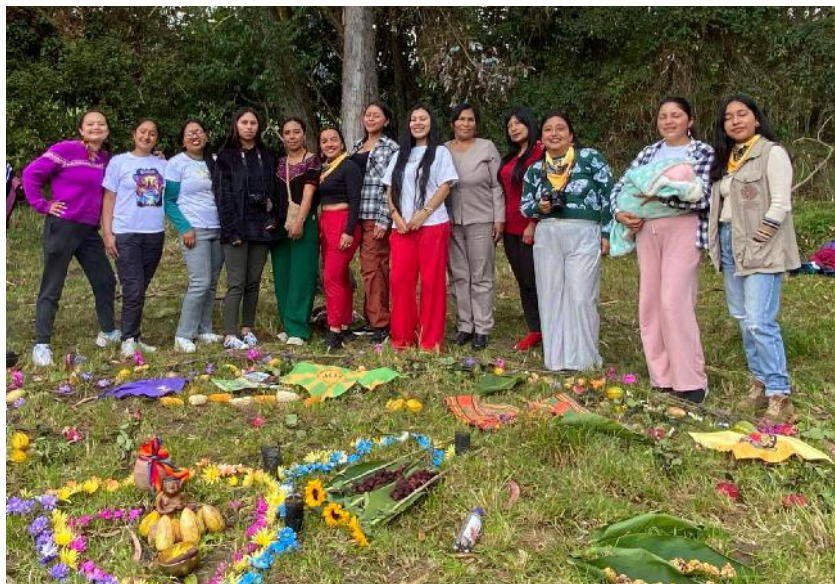
Fundación CUAS-COLECTIVO AKMUEL