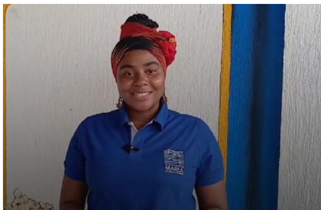
Organización "Marea Producciones" Ganadora de Afrocolombias 2025

"Este boletín se realiza en el marco del Convenio Interadministrativo No. 0798-2025 entre el Ministerio de las Culturas, las Artes y los Saberes y el Fondo Mixto de Cultura de Nariño"