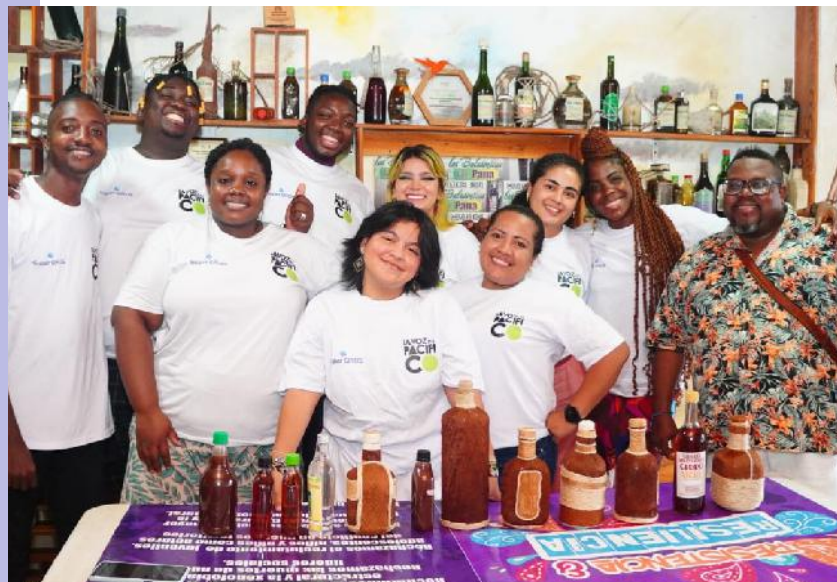
Organización La Voz del Pacífico "JMD LA VOZ"