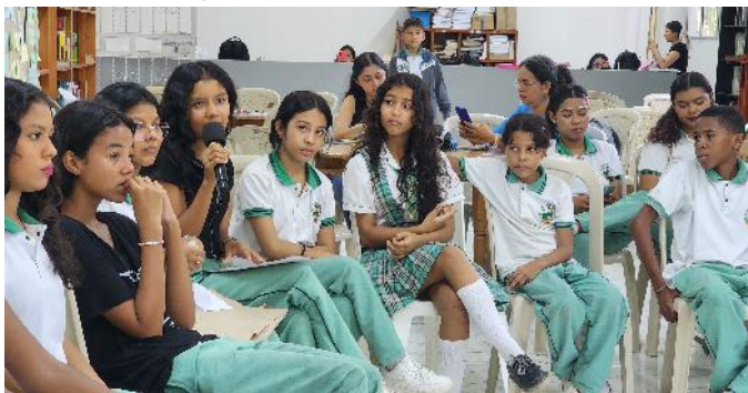
Jóvenes y niños Institución Educativa José Celestino Mutis

La iniciativa pertenece a la Estrategia Comunicación, Infancia y Juventud y se ejecutó en alianza con la Corporación Juntos Construyendo Futuro y la Comisión de Regulación de Comunicaciones - CRC.