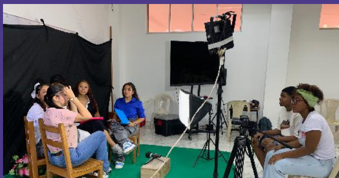
Taller sobre alfabetización mediática

Esta actividad se desarrolló con el propósito de ofrecer herramientas y espacios pedagógicos que le permita a esta población, conformar un pensamiento crítico frente a la información que circula en la web, usar de manera responsable el internet, adoptar medidas de protección de la privacidad, así como establecer mecanismos que permitan prevenir riesgos en los entornos digitales.