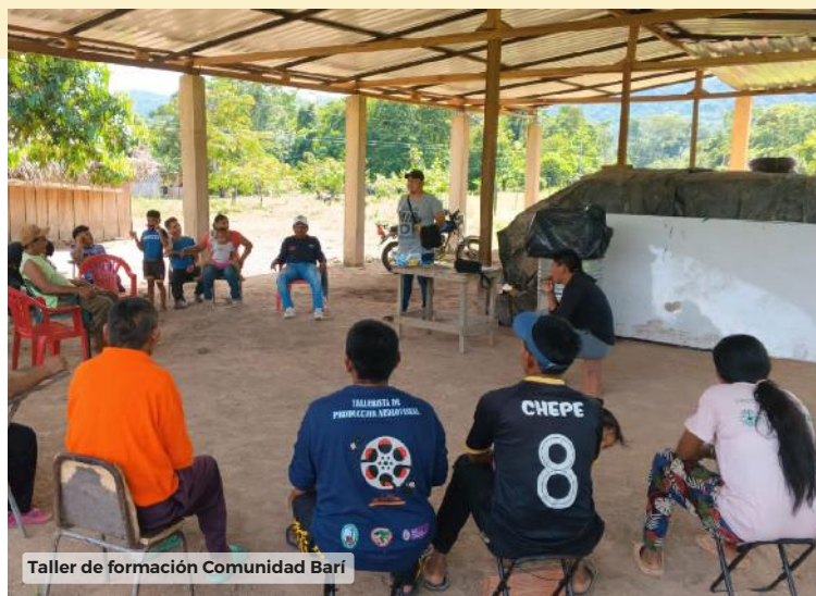
Taller de formación Comunidad Barí

*Esta iniciativa surgió del diálogo con la Dirección de Audiovisuales, Cine y Medios Interactivos DACMI del Ministerio de las Culturas, las Artes y los Saberes y la Asociación de Autoridades Tradicionales del Pueblo Barí ÑATUBAIYIBARI.