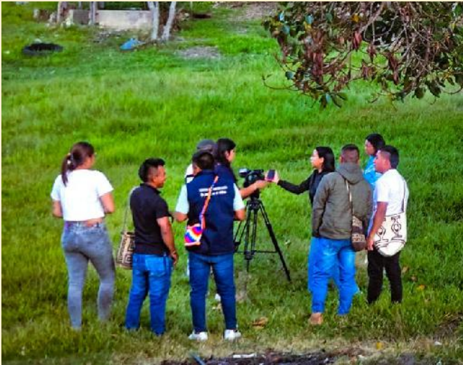
Encuentros de Armonización Programa Vientos de Comunicación