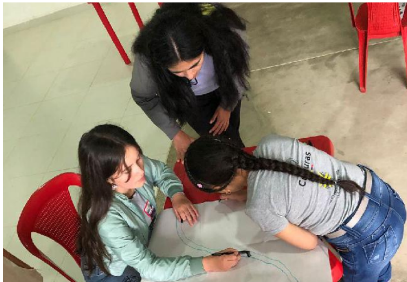
Encuentro Formativo Visualizarte 2.0