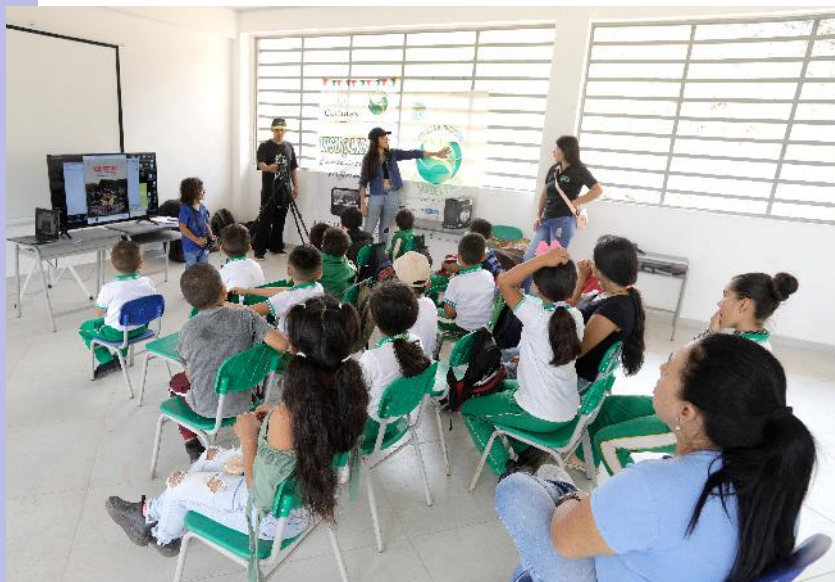
Escuela Audiovisual Voces del Pato