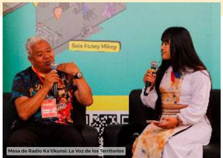
Mesa de Radio Ka'tikunsi: La Voz de los Territorios