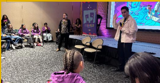
Laboratorio de Cine Infantil Segunda Edición en el marco del BAM