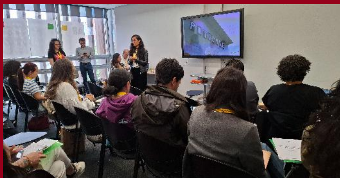
Encuentro de Canales Públicos

Luego de la investigación y análisis de los contenidos infantiles y juveniles en la televisión pública, realizado por la estrategia de Comunicación, Infancia y Juventud de la DACMI, se realizó el encuentro con canales públicos para buscar soluciones, mejorar producciones y fortalecer la programación. El evento reunió a ocho canales y entidades como la Comisión de Regulación de Comunicaciones, MinTIC y Min-Cultura.