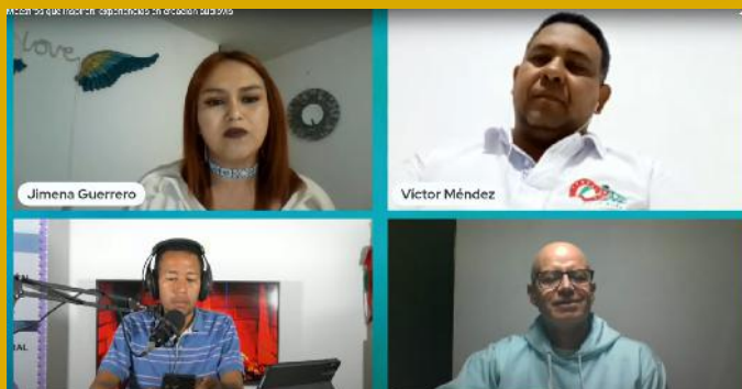
Conversatorio virtual. Maestros que inspiran: experiencias en creación audiovisual