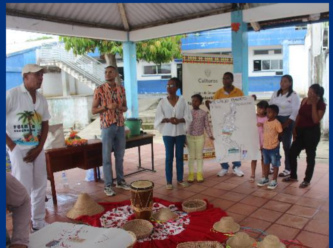
Comité Etnoeducativo de Puerto Escondido - Estrategia Afrocolombias

Por su parte la organización Puerto Escondido, que utilizó una metodología participativa de diálogo intergeneracional, en el que los adultos transmiten su conocimiento a los niños y viceversa, resalta la importancia de la interacción entre generaciones para compartir sus experiencias y saberes. El bullerengue, para esta organización se constituyó como la temática central para fortalecer ese vínculo entre la educación y la cultura.