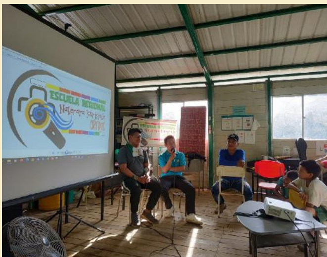
Taller comunicación digital - CRIDEC