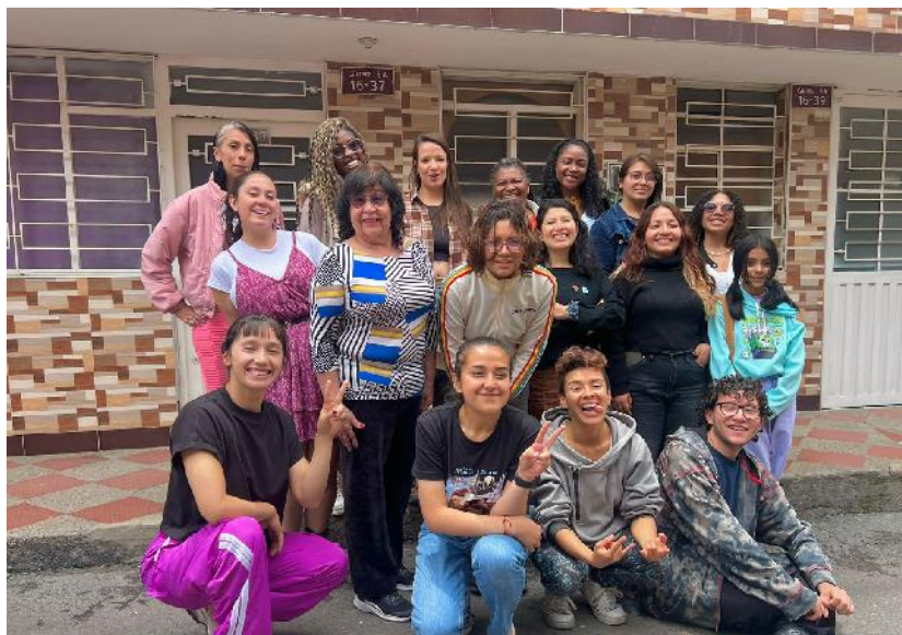
Corporación Telescopio de Papel