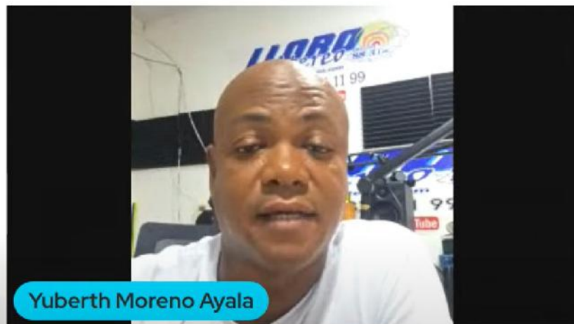
Conversatorio Territorios al Aire 2025. Red Barule

La Corporación Telescopio de Papel, que hace parte de esta estrategia, culminó su proceso de pasantía en el marco del evento Luminiscencias: Formación audiovisual para mujeres ; en el que los pasantes de tres colectivos de comunicación compartieron sus experiencias en comunicación comunitaria, participaron en talleres prácticos de creación audiovisual y en espacios de co-creación metodológica para fortalecer la Red de Comunicación para la Vida.