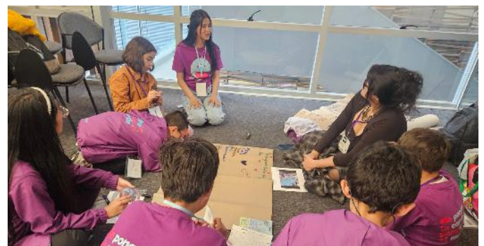
Participación Generación Eureka

Internacional Prix Jeunesse, estos 20 participantes y 7 niñas, niños y adolescentes de la Generación Eureka vieron y dialogaron sobre contenidos audiovisuales de diferentes partes del mundo, dirigidos a primera infancia, infancia y adolescencia.