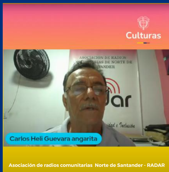
Asociación de radios comunitarias Norte de Santander - RADAR