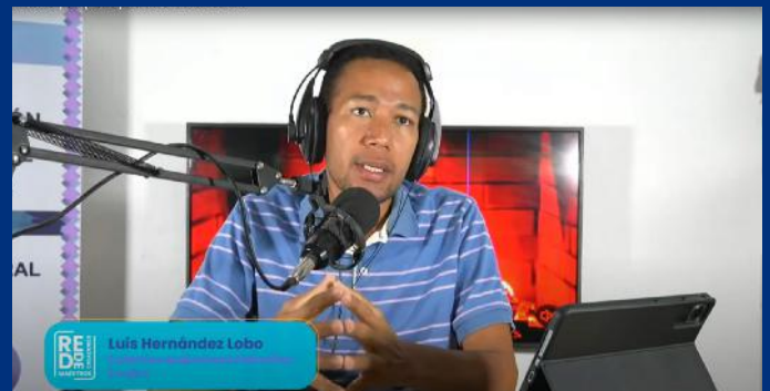
Colectivo audiovisual Palomitas - Guajira