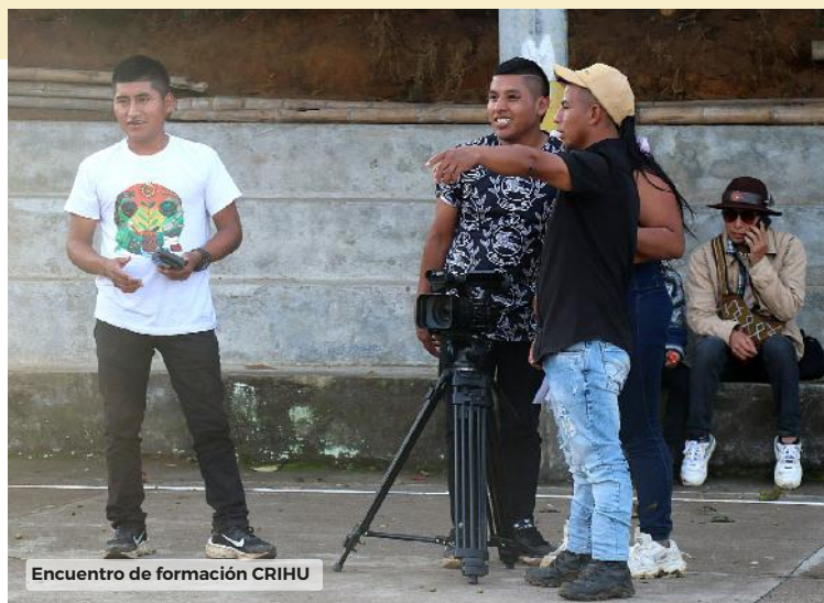
Encuentro de formación CRIHU

Para el cierre del proceso formativo el CRIHU conformará un espacio de proyección de la consejería de comunicaciones, de socialización de las producciones audiovisuales, sonoras y de otras formas de comunicación contadas desde la mirada de los jóvenes.