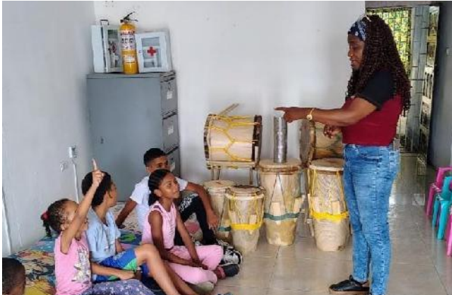
Asociación de Mujeres por un Caribe Mejor - Estrategia Afrocolombias

"Este boletín se realiza en el marco del Convenio Interadministrativo No. 0798-2025 entre el Ministerio de las Culturas, las Artes y los Saberes y el Fondo Mixto de Cultura de Nariño"