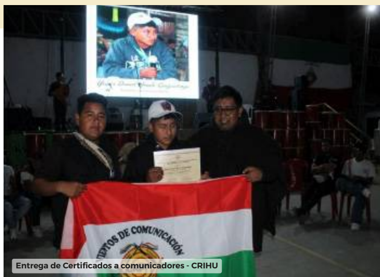
Entrega de Certificados a comunicadores - CRIHU

Con una ceremonia simbólica, los comunicadores formados en la Escuela recibieron sus certificados, como una manera de fortalecer el compromiso de la juventud en la implementación de propuestas comunicativas que les permita seguir aportando a la consolidación de su identidad, la defensa de su territorio y la construcción de la paz.