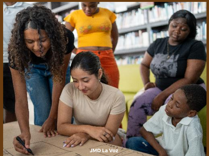
JMD La Voz

La propuesta dirigida a JyA de 12 a 15 años, resignificó el concepto de "influencer" como liderazgo comunitario con incidencia en los procesos territoriales.