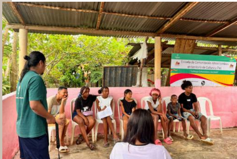
Encuentro agentes de comunicación

El encuentro permitió reconocer la labor de los agentes de la comunicación en sus comunidades e intercambiar las experiencias sobre el proceso del cine comunitario como una forma de narrar sus territorios e incidir en ellos.