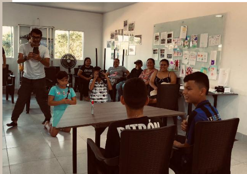
Escuela de Formación y Comunicación Campesina

El tema central de este espacio fue la Comunicación comunitaria desde la memoria y el territorio. Temática que permitió reflexionar sobre el papel de la comunicación como herramienta política y organizativa en la ruralidad.