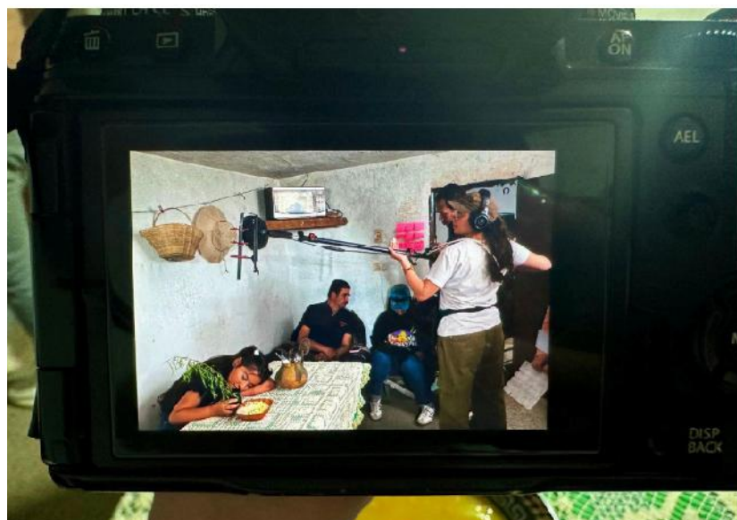
Detrás de cámaras cortometraje "Mujeres Resueltas"