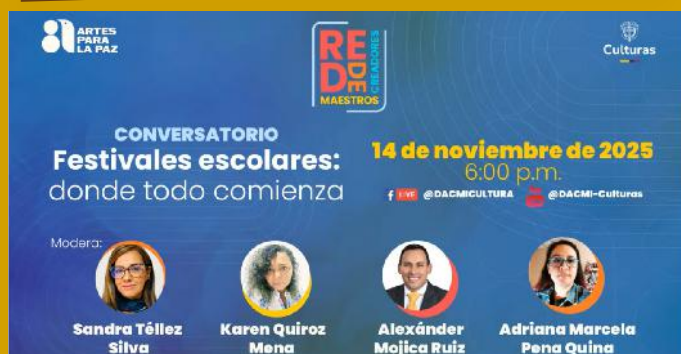
Conversatorio virtual. Festivales Escolares