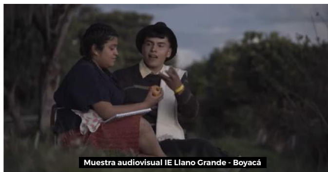
Muestra audiovisual IE Llano Grande - Boyacá

Estos conversatorios que se han constituido como mesa virtual, han contribuido no solo a la visibilización de las propuestas que se forjan en los territorios para transformar sus comunidades, sino también para debatir y plantear propuestas que aporten desde lo experiencial y académico.