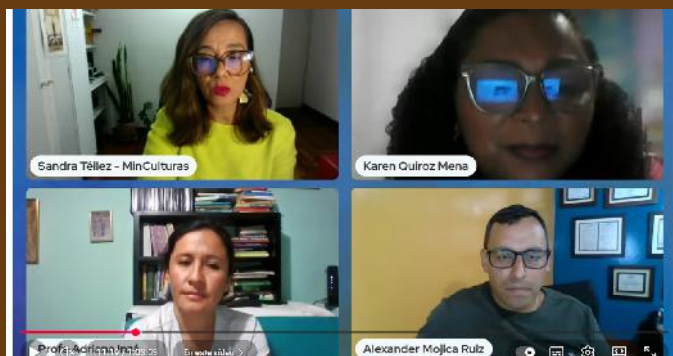
Conversatorio Virtual RED de Maestros