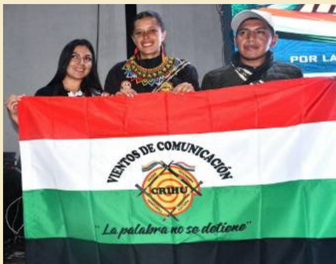
Cuarto Encuentro Intercambio de Experiencias - CRIHU